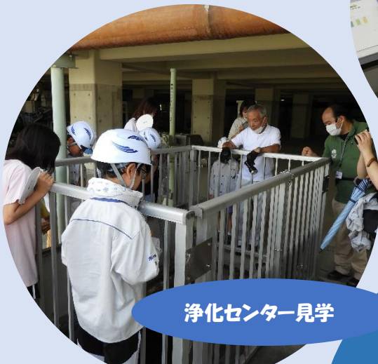
浄化センター見学