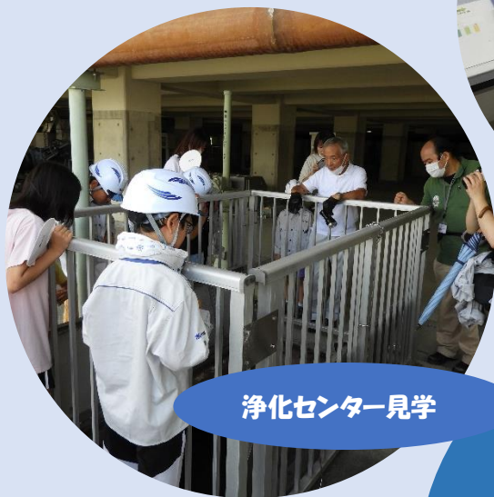
浄化センター見学