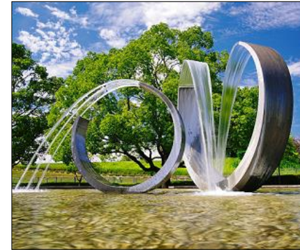
入選『浄化流麗』 竹岡 正行