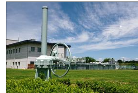
入選『天空煌めく浄化センター』 藤井 弘司