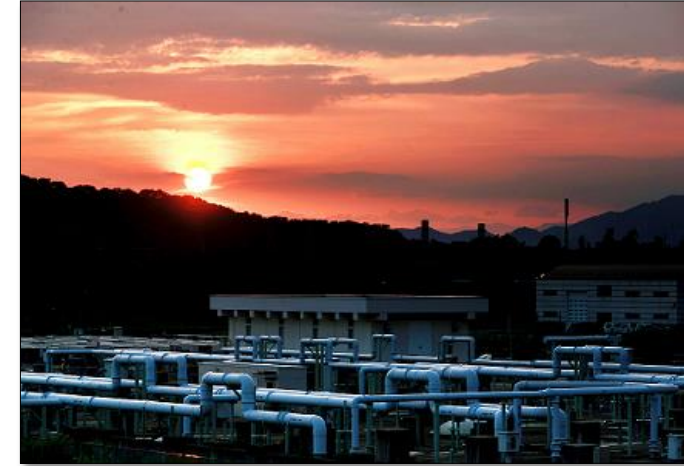
流域浄水事務所賞『輝く浄化設備』 川合 定治