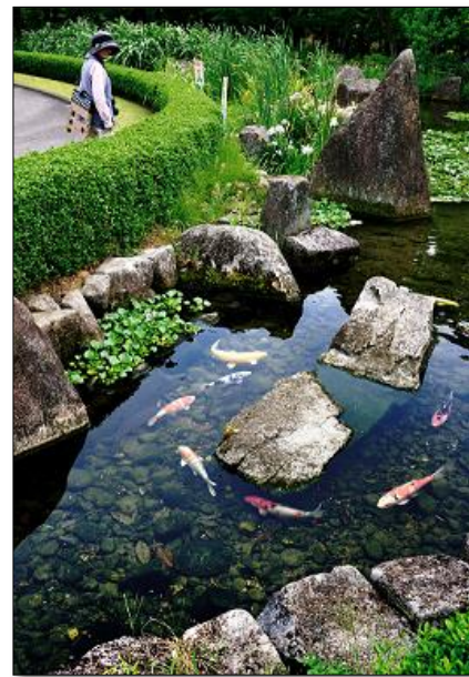
特選『つい見とれて』 鈴木 哲夫